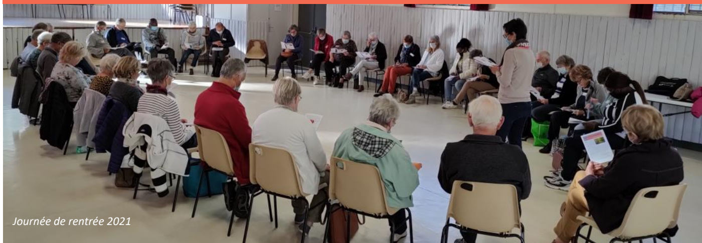
Journée de rentrée 2021

EDITO Alors que l'entrée dans la période hivernale nous inciterait à une pause naturelle à l'image de notre environnement, l'ambiance de cette fin d'année 2021 vient nous rappeler les grands enjeux du moment : pandémie, réchauffement climatique, augmentation des prix des biens de première nécessité, plongeant un peu plus certains dans la précarité.